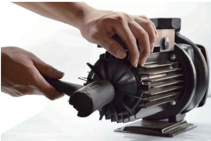
步驟10:利用槌子將風扇敲入