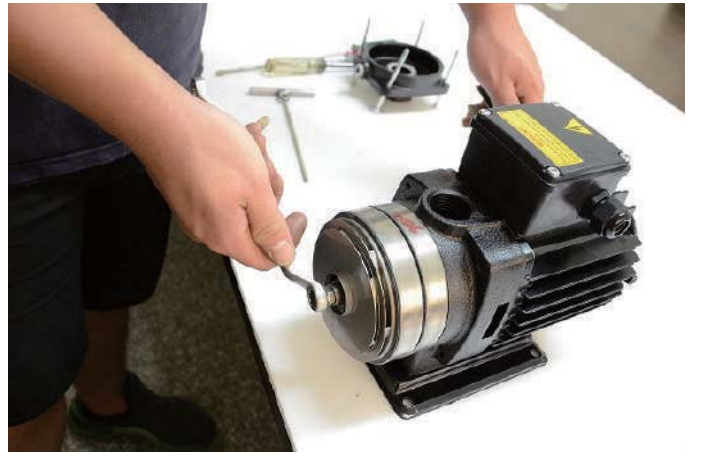
步驟9:放入防鬆螺帽,握緊萬用鉗,利用梅花扳手鎖上防鬆螺帽