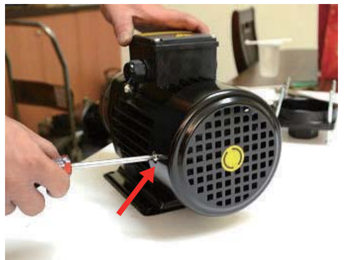
步驟11:使用十字螺絲起子將風扇蓋螺絲鎖上