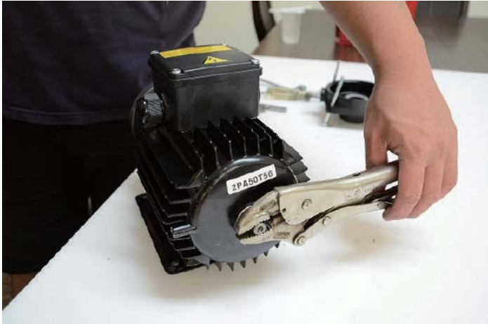
步驟8:使用萬用鉗夾住馬達軸心尾端